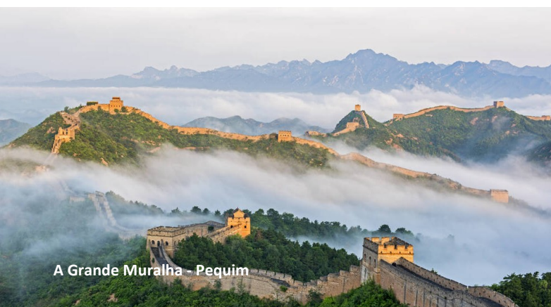
A Grande Muralha - Pequim