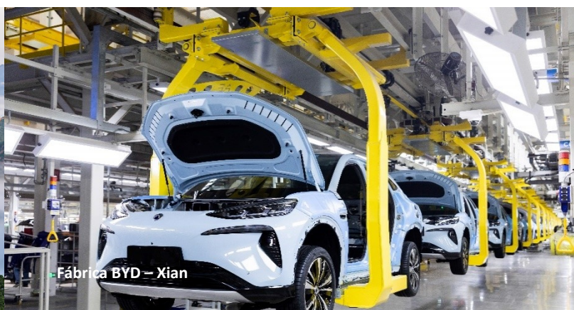
Fábrica BYD – Xian