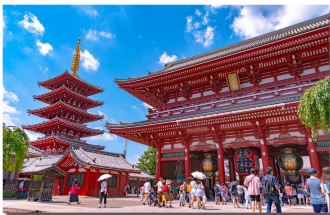
Templo Sensoji em Asakusa, o templo mais antigo de Tóquio que contém uma estátua sagrada de Kannon, a deusa da Misericórdia.