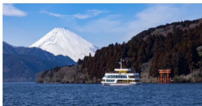
Lago Ashi é cercado de montanhas por todos os lados e local de incríveis vistas do Monte Fuji.