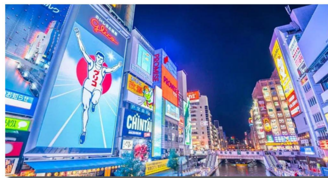
Dotombori, um dos principais destinos turísticos de Osaka pela sua enorme variedade de lojas e gastronomia entre outras diversões.