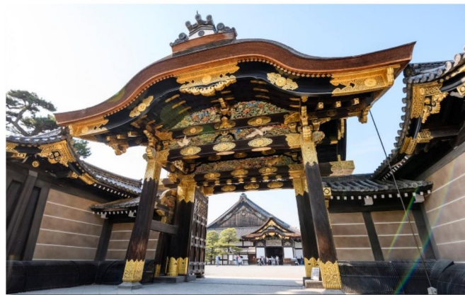
Castelo de Nijo, Possui grande importância histórica e exemplo da arquitetura de um castelo da era feudal.