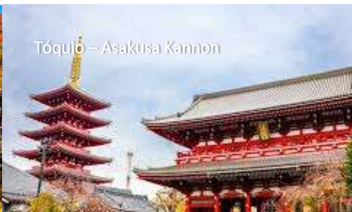
Tóquio – Asakusa Kannon