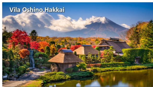
Vila Oshino Hakkai