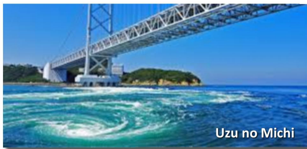
Uzu no Michi

Refeições: Café da manhã e almoço e jantar.