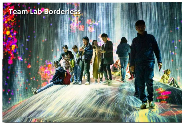
Team Lab Borderless