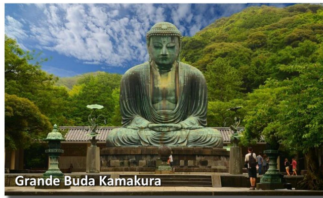
Grande Buda Kamakura